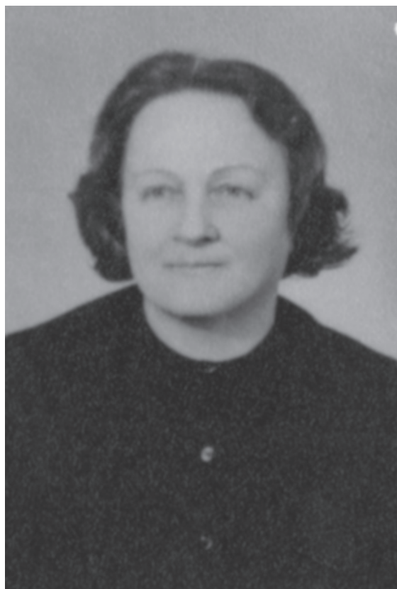
Mama, ki me je vzgojila

Do našega stanovanja na Čevljarski so vodile strme lesene stopnice, ki so pod težo odraslih neusmiljeno škripale. Vedno so se mi zdele nekaj posebnega, kdaj pa kdaj rahlo strašljive, zlasti ko je po njih hodila naša soseda. Majhna, precej drobna in sključena ženica, Italijanka, vedno oblečena v črno, jo je ob večerih mahala na sprehod in v bližnjo stolnico k maši ter se vselej vračala v