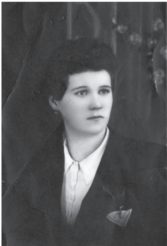
Mama, ki me je rodila

Ko so se dogovorili o moji selitvi, sem s teto in stricem odšla v njun svet. V Kopru je stric kot okrožni gospodarski sodnik dobil službo in moj dom je postala Čevljarska ulica 28. Koper je zato v mojem življenju pustil neizbrisen pečat. So namreč osebe, ulice in stavbe, ki jih nikoli ne pozabiš. Nikoli. Četudi pridejo novi kraji in novi ljudje.