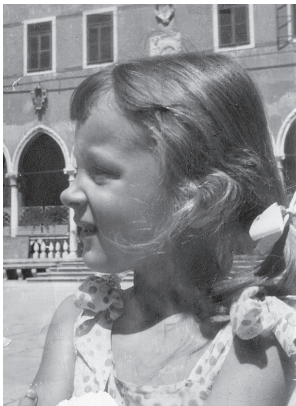
Pred kavarno Loža

udarec. Razburilo ga je, ko sem s povsem novimi črnimi lakastimi čevlji in belimi dokolenkami, takimi s cofki, skočila v lužo in škropila naokoli, čeprav sta me večkrat opozorila, celo prosila, naj tega ne počnem. A takoj potem se mi je opravičil in rekel, da sem kot otrok šibkejša in da si odrasli tega ne smejo dovoliti. Da morajo z besedo doseči, kar želijo. Nikoli nisem bila tepena in njegove