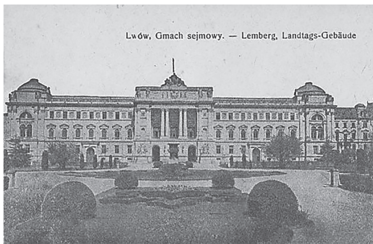
Galicijski parlament, avstro-ogrška monarhija

Šest desetletij kasneje, ko sem bil na klopi, na kateri je morda sto let prej sedel moj stari oče, sem bil v Parku Ivana Franka, poimenovanem v čast ukrajinskemu pesniku, ki je pisal detektivske romane in čigar ime nosi zdaj tudi univerzitetna stavba. 8